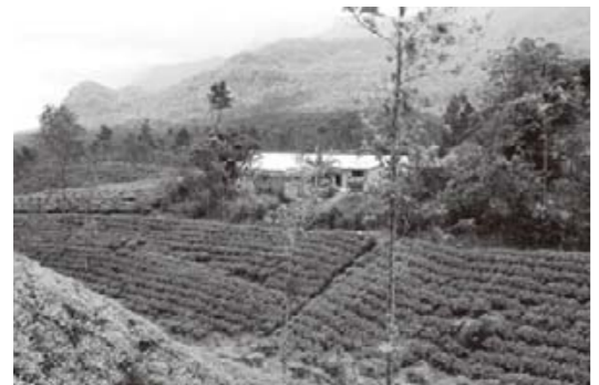
広大な農園では輸出用の紅茶を生産している