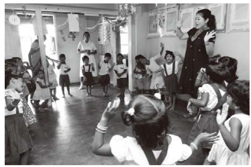
「大きな栗の木の下で」を練習する子どもたち。発表会には保護者や農園のマネージャーも招待した