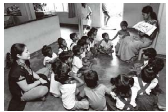
保育士たちも絵本の読み聞かせに慣れてきた

「ジャンティーチャーはいろんなことを教えてくれる」と、託児所に通う子どもたちが増えた