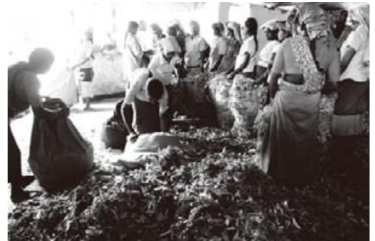
託児所の近くの計量所に収穫した茶葉を運んできた母親たち