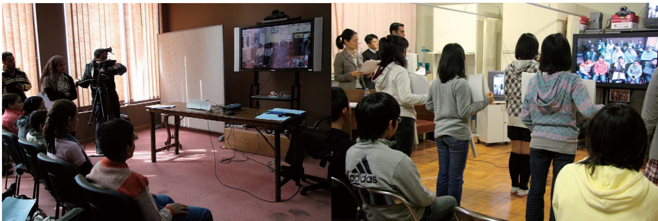
芦原小学校の保健の取り組みをエジプトへ。芦原小学校(右)とJICAエジプト事務所(左)がテレビ会議を通じて結ばれた

子どもの健康を守るために大切な“学校保健”のシステム。 その取り組みを伝えようと、JICAのテレビ会議システムを通じて、 愛知県豊橋市立芦原小学校とエジプトのロダ小学校の子どもたちが出会った。