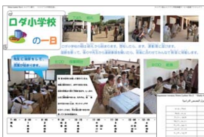
昨年9月から、両校はニュースレターを交換。事前交流として、お互いの学校生活を伝え合った