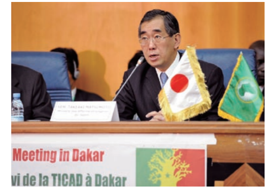
今年5月に開催された第3回TICAD閣僚級フォローアップ会合で松本外務大臣は、東日本大震災に対するアフリカ各国からの支援に感謝を表明。日本として引き続きアフリカを支援していく決意を述べた