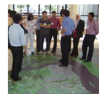
東南アジアも熱帯雨林の宝庫。インドネシアやマレーシアなど6カ国の研修員がブラジルを訪れ、観測技術を学んだ

途上国から途上国への技術移転を先進国が支援する「三角協力」は、今でこそ世界で行われるようになったが、JICAは他ドナーに先駆け、80年代から行ってきた歴史がある。ブラジルで始まった「熱帯雨林監視システム」は今や全世界に広がっている。