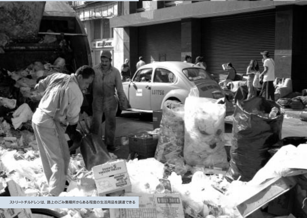
ストリートチルドレンは、路上のごみ集積所からある程度の生活用品を調達できる