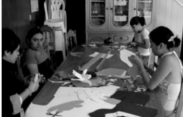
施設で厚紙を使って工作をする少女たち

用からの脱却、心身のケア、復学や職業訓練といった包括的なプログラムを実施できるように、04年に「ストリートチルドレン（女子）の社会復帰支援プロジェクト」を開始した。