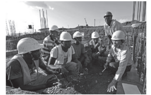
オールジャパンでの連携を強化し、現場に根差したODA事業を目指す

「ココが知りたい」。国際協力に関係する いろんなトピックを分かりやすく解説します！