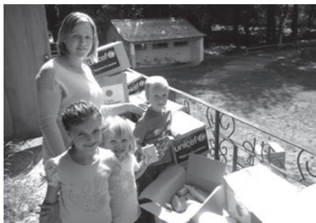
日本の協力で届けられた支援物資

ウ クライナは、東はロシア、西はポーランドに接する東ヨーロッパにあり、ソ連崩壊に伴って独立しました。国土は肥沃な平原に覆われ、夏にはヒマワリが咲き誇るとも美しい国です。 しかし現在、この国は建国以来最大の危機に直面しています。2013年11月に発生した小規模な反政府デモをきっかけに、首都キエフ市の中心部で大規模な占拠、衝突が発生しました。このため、大量の国内避難民の発生や経済の急激な落ち込みなど、深刻な被害が発生しています。 このような状況を踏まえ、日本は最大約1500億円の大規模な支援を発表。その中には、キエフ市にある