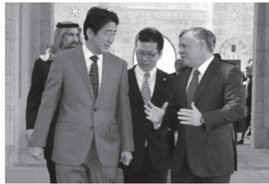
アブドゥラー2世・ヨルダン国王陛下の出迎えを受ける安倍総理