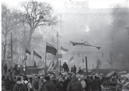
キエフ市内での衝突の様子