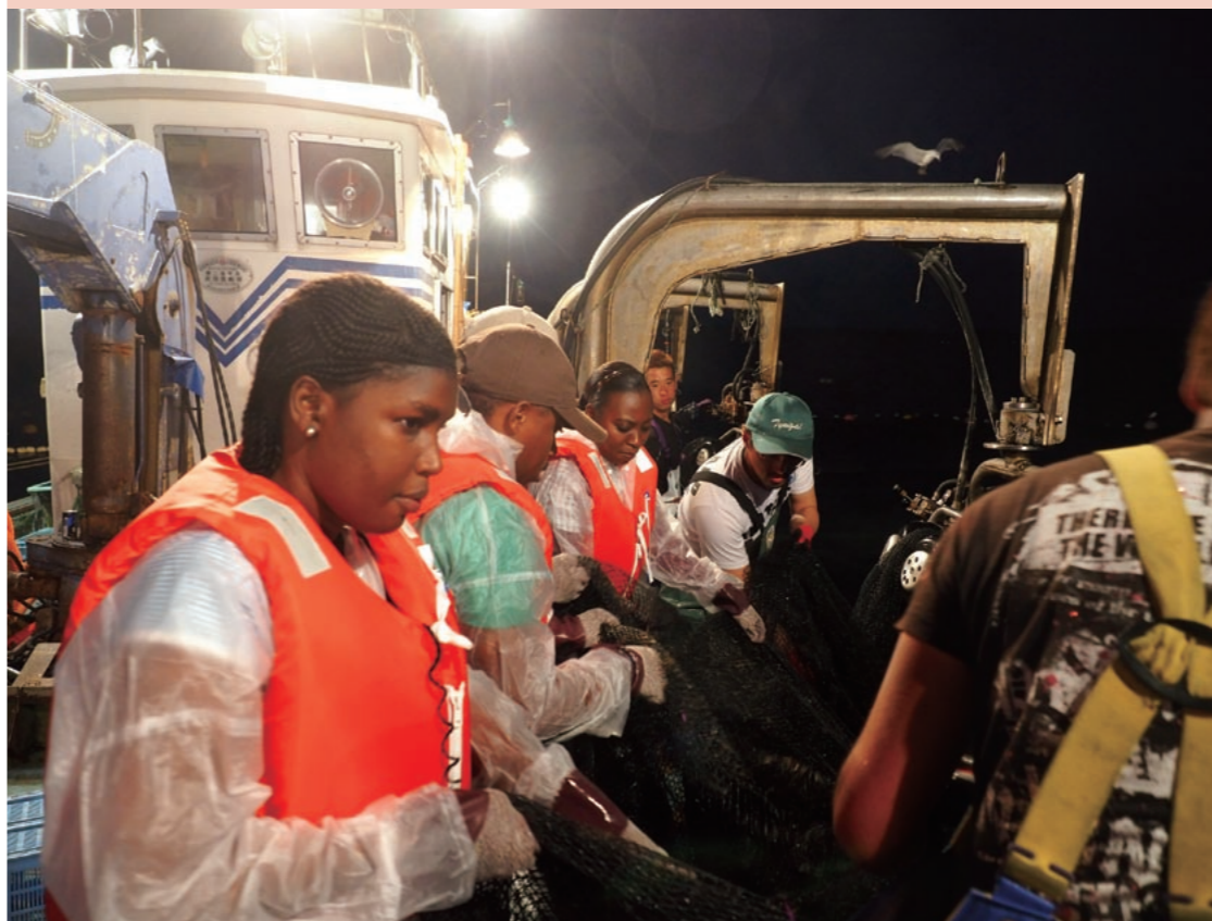
箱網の起こしを手伝う研修員たち。ただ引き上げるだけでなく、その場で仕掛けを海に戻していくことに驚いていた

能登半島の付け根にある大泊鼻(石川県七尾市)から黒部川の河口に位置する生地鼻(富山県黒部市)まで広がる内湾。沿岸からすぐ水深1,000メートルに達する海は、立山連峰から流れ込む栄養分豊富な表層水のほか、浅い部分には対馬暖流が流れ込み、深い部分には冷たい海洋深層水をたたえていることから、約500種の魚がすみ、多くの漁港が栄えている。特に、1570年ごろに始まった定置網漁が盛ん。