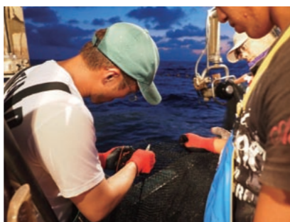
破れた網を、その場ですばやく繕って海に戻す。その場で戻すので、仕掛け直す手間が掛からない

フリカの8カ国から14人の研修員が集まった。二週間半の研修で、定置網漁のほか、魚の養殖や水産行政などについても学ぶ。