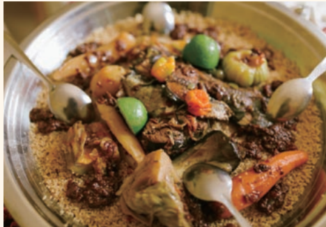
魚の炊き込みご飯、チェブ・ジェン。チェブはコメ、ジェンは魚で、文字通り「魚ご飯」の意味になる