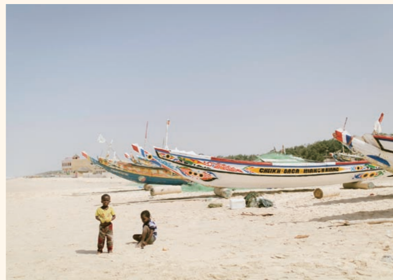
ダカールより南のプティット・コート(小海岸)地域で使われる伝統の漁船。北部のものより小さく、2~3人乗りだ

このとき重視されたのは、漁師たちが自分たちでそれぞれの漁村での課題を話し合い、解決方法を決めて、自ら守る、ボトムアップの管理方法だ。セネガルでは政府の予算や人員の関係で、行政が上から規制を定めて適用するのが難しい。一方、漁師たちにとっても、経験に基づき自分たちで考えた計画の方が守る意識が高まる。もともと漁師たちも、魚の減少や小型化に対する危機感を抱いていたため、COGEPASは順調に展開した。2014年からは、新たにバリエーション開発による水産資源共同管理促進計画策定プロジェクト(通称PROCOVAL)としてパイロットプロジェクトを実施している。具体的には、①欧州および国内市場向け高級鮮魚の