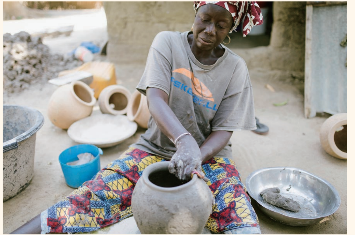
タコつばは、地元の女性たちの手で一つ一つ作られる

あります。まずは水産資源の共同管理を通じて漁獲量を安定させ、次いで水揚げ場や鮮度維持のための製氷機、輸送インフラなどを整備すれば、国内外の水産物の流通量と品質が向上するでしょう」と期待を込めて語った。 一連の水産資源共同管理や品質向上の取り組みは、今後、国全体や近隣国への展開を視野に入れていく。日本とセネガルのさらなる協力は、セネガルの水産業と日本の食卓を、共に豊かにしてくれる