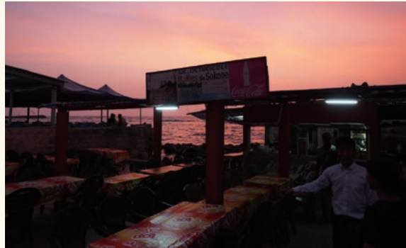
ダカールがあるヴェルデ岬の突端・アルマディ地区は、アフリカ大陸最西端の地でもある。日本の青年海外協力隊による生ガキの販売支援がきっかけで、今では海鮮屋台が立ち並ぶ名所に