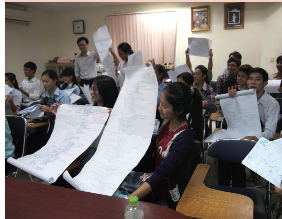
カンボジアの日本法教育研究センターで行われている民法の授業の様子。使われているテキスト(右)も全て日本語だ