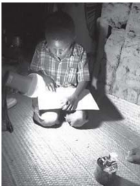
灯油ランプをLEDランタンに置き換えて勉強する男子

JICAは、10月19日、株式会社DGB(DGB) (以下「DG社」との間で、「オフグリッド太陽光事業」を対象とする3億円の投資契約に調印しました。 DG社のオフグリッド太陽光事業は、サブサハラ・アフリカの未電化地域の小売店に太陽光パネルを設置し、BOP層中心の来店客に対して、LEDランタンの充電とレンタルや、携帯電話の充電サービスを行うものです。 既に事業を開始しているタンザニアでは、特に地方部の電化率の低さ(4%未満)が問題となっています。電気のない世帯は、灯油ランプなどに明かりを依存しており、煙害や温室効果ガスの排出が問題となっている他、灯油の購入費が家計の負担となっています。 本事業により、これらの解決だけでなく、灯油ランプよりも明るい光の下で、夜間に子どもが勉強したり、小売店が営業したりできるようになります。LEDランタンのバッテリーを使えば、BOP層の生活に不可欠な携帯電話の充電もできるため、生活の改善につながります。DG社は、JICAの投資を通じて事業の拡大を目指します。