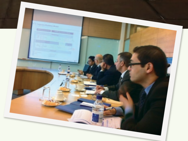
ヨルダン政府のスクーク発行に向けた実務能力強化を目指して、既にイスラム金融が発展しているマレーシアで研修を行った