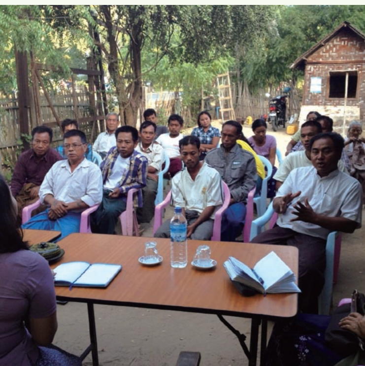
「天候インデックス保険」の開発にあたって、損害保険ジャパン日本興亜株式会社の担当者がミャンマーでヒアリング調査を行った

一方、開発途上国への支援や国際課題の解決につなげるための資金調達手段として日本国内で関心が高まっているのが、JICA債だ。JICA債は2008年から発行され、調達資金は全額、政府開発援助（ODA）の円借款と海外投融資に充てられている。