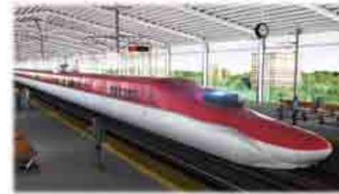
ムンバイ-アーメダバード間高速鉄道CGイメージ図

とアーメダバード間をつなぐ陸上交通は道路のみで、移動に7時間近くかかっています。高速鉄道が開通すれば2都市間が2時間でつなぎ、輸送能力を格段に向上させることができます。さらに、日本で培われてきた分刻みの運行管理やメンテナンスなどの技術移転も行う予定です。鉄道の開通で、雇用の創出、人と物の移動の円滑化、周辺地域での開発や地域の経済発展がよりいっそう進むでしょう。