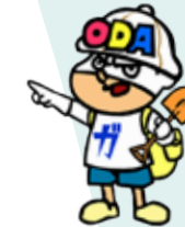
外務省開発協力広報キャラクター ODAマン

開発協力という分野で外務省はどんな役割を果たしているのでしょうか? 毎回、テーマに沿った質問に外務省が答えます!