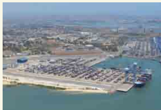
「モンバサ港開発計画」で整備した新コンテナターミナル

ケニアの首都ナイロビから500キロ離れたモンバサは、東アフリカ地域のゲートウェイとしてケニア国内の輸出入の拠点となっています。また、ケニアからウガ