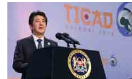
TICAD VIで基調演説を行う安倍総理大臣

また最近では「在外公館レポート」(次ページ)でも紹介しているケニアのモンバサ港の整備とそこにつながる道路の建設を行っています。これは、ケニアとその周辺国の連結性を強化することにつながります。将来的にはモンバサ港が東アフリカの物流拠点となり、ケニアのみならず、東アフリカ諸国の経済成長につながっていくと期待されています。