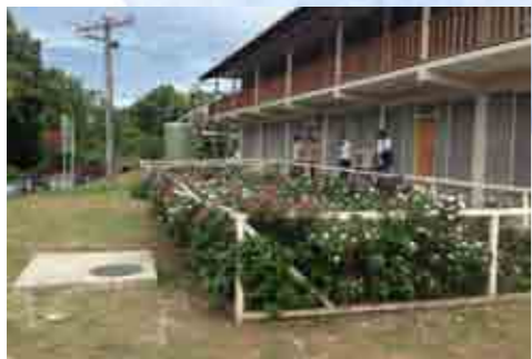
ソロモン諸島でも導入。土壌処理装置の上に植栽すると、処理水によってよく育つ。ニチニチソウが咲いた様子。