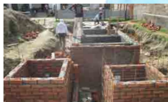
消化槽の施工風景。資材の大半は現地調達が可能のため設置コストも低い。

インドは今でも、人口の約半数が野原ややぶなど野外で排泄をしているという。2011年の国勢調査によると、戸別トイレの普及率は46・9パーセント、野外排泄人口は5・9億人と世界最多である。トイレは不潔で遠ざけるもの、という古来の考え方もその背景にあると言われ、住宅の敷地内に設置されないことも多い。野外排泄は女性にとって危険を伴い、用を足すときに性的暴力事件に巻き込まれることが少なくない。そのため自己防衛として、近所の女性で集まって人目の少ない夜明け前に集落の外で排泄している例も多いという。排泄を1日1回しか行わないことも心身のスト