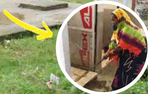
トイレに女性が常駐して維持・管理を行う予定となっている。

JICAはインドに対して、ガンジス川(支流のヤムナ川を含む)流域に約1,000基の公衆トイレを設置するなどの協力を続けている。