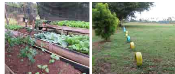
コスタリカでの生活改善の普及の一例。左：住民が始めた家庭菜園。右：共用地の広場は廃タイヤを活用して整備された。