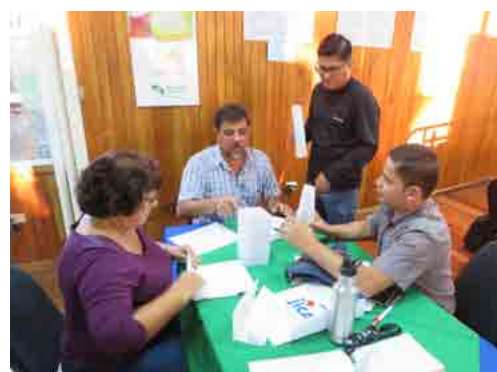
住民に生活改善をどう普及させていくか、その手法について普及員がおたがいの意見を述べ合いスキルアップを図る。