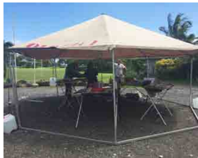
村落地域に赴き、村の人たちに去勢避妊プログラムを説明する。

の大学に行かなくてはならないのですが、私の活動で獣医を目指す子どもたちが増えてくれたらうれしいです。 サモア人は外国人に優しく、とてもフレンドリーなので、身近な生き物にも同じような気持ちで接してくれることを願っています。 サモアでの活動を通して、私自身も動物の福祉や愛護について考えを深めることができました。日本でも避妊去勢活動や保護動物飼育の推奨などが必要な状況があるので、帰国後はサモアの経験を生かしたいと思っています。