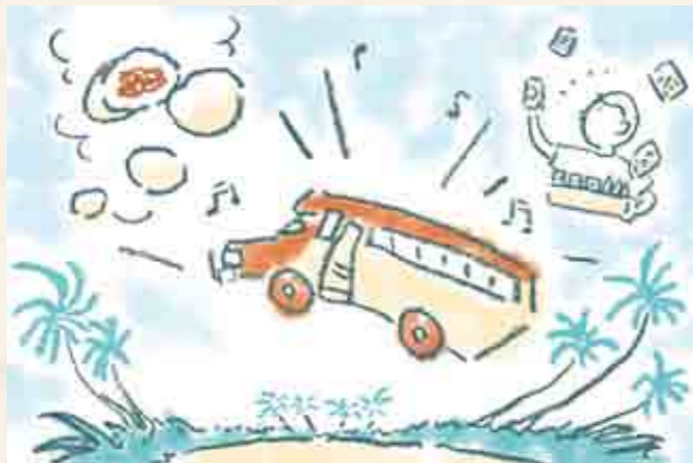
イラスト ● さかがわ成美

途中でバス停はなし。乗るときは運転手に目で合図を送ってバスを止める。降りるときは手作りのブザーを鳴らすか、窓にコインを当てて、カンカンと音を出す。大音量の音楽が流れていても運転手はしっかり聞き取ってくれる。混み合ってくれば、知人でなくても座っている人のひざに座ってしまう。またお年寄りや子ども連れの乗客には、当たり前のように席を譲る。木の椅子は長時間座っていると少々しびれてくるが、私にとってバスは、サモアの美しい景色や食べ物、人柄を感じられる場所だ。(柏山 麗)