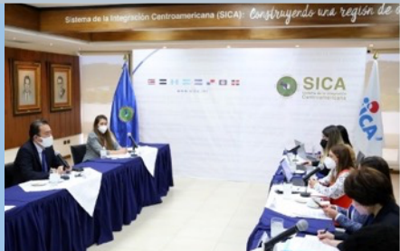
JICA 中南米部長の SICA 事務総局訪問における意見交換風景