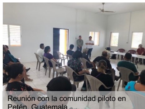
Reunión con la comunidad piloto en Petén, Guatemala