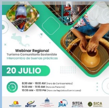
Invitación para el Seminario Regional "Turismo Comunitario Sostenible"