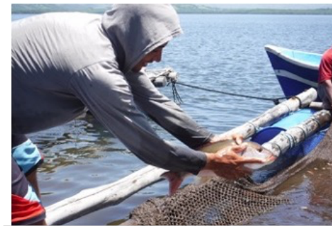
ニカラグアのパイロット村落のタイ養殖の様子