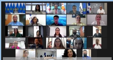
「持続的コミュニティ観光」セミナー発表者集合写真