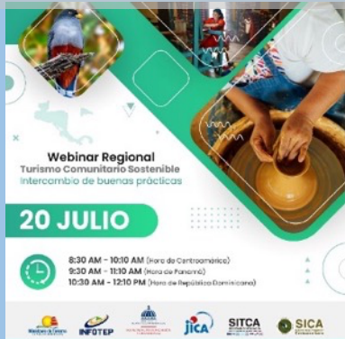
SICA 地域セミナー「持続的コミュニティ観光」招待状