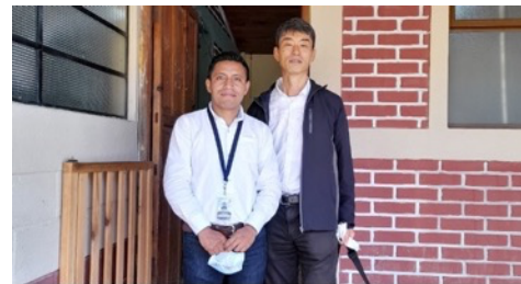
グアテマラにおける援助事例調査。グアテマラ、キチェ県ウスパンタン市の元生活改善普及員と。