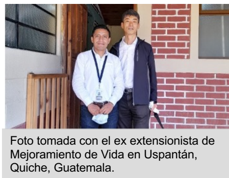
Foto tomada con el ex extensionista de Mejoramiento de Vida en Uspantán, Quiche, Guatemala.