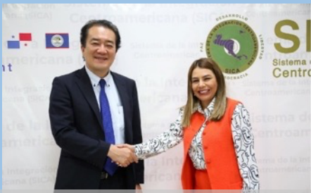
JICA 小原中南米部長と SICA 事務総局アルピサール国際協力局長