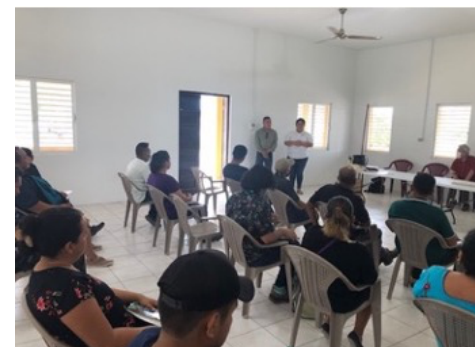
グアテマラ・ペテン県のパイロット村落での会議