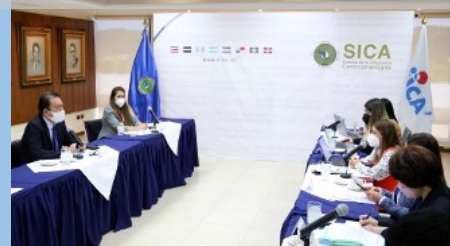
Intercambio de ideas para el futuro de cooperación regional SICA-JICA en la sede del SICA