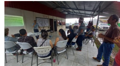
養蜂コンポーネントのセミナー (ラ・アミスタ: コスタリカ、パナマ)