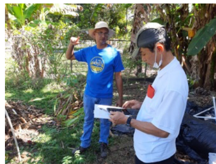
Entrevistando con ex becario del curso de agricultura orgánica en Panamá