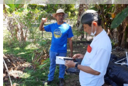
有機農業研修の帰国研修員に取材 (パナマ)