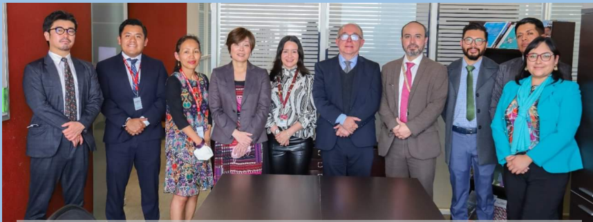
メキシコ国際協力庁 (AMEXCID) 及びメキシコ事務所スタッフと櫻井専門家