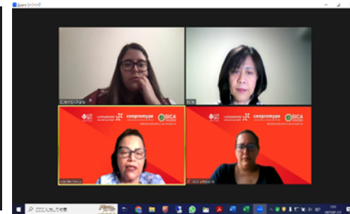
Reunión virtual con CENPROMYPE