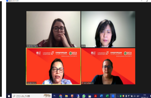
CENPROMYPE とのオンライン会議