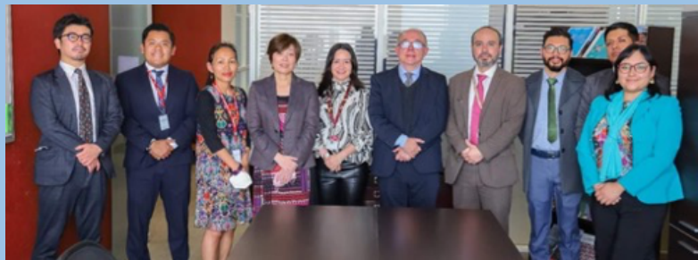
Con los funcionarios de AMEXCID, México y de JICA México