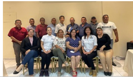
参加型農村開発ネットワーク (REDGAM) の帰国研修員との集合写真 (パナマ)