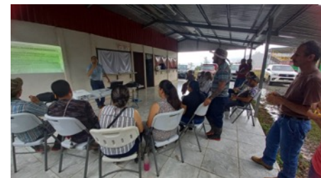
El seminario sobre el componente apícola (La Amistad: Costa Rica y Panamá)