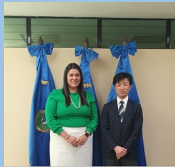
SICA 事務総局国際協力強調と石亀調査団長