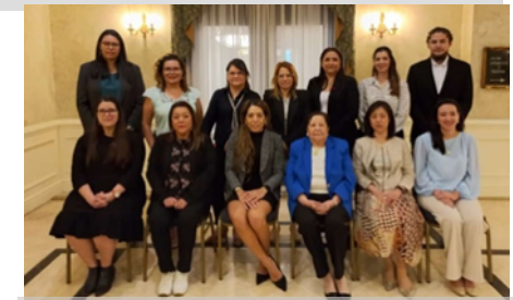
第三回地域ワークショップ