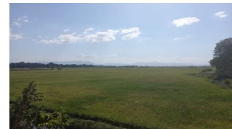
El paisaje de Montecristi, República Dominicana