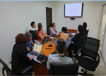
Reunión técnica entre el equipo de los expertos y la SIECA