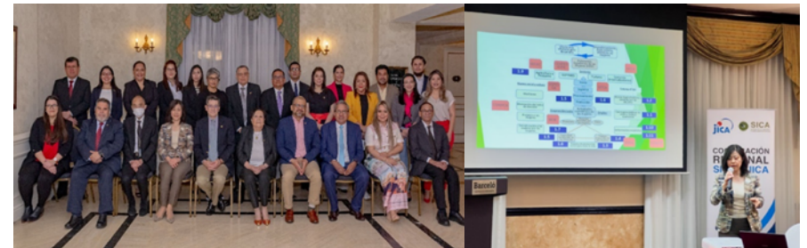
Reunión de CD-PRIEG