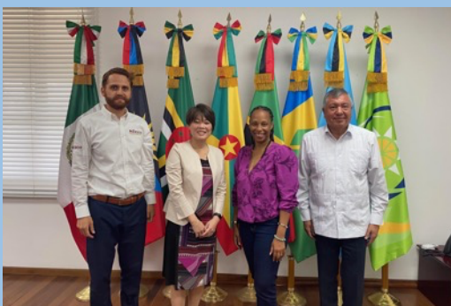
在セントルシアメキシコ大使館及び JICA セントルシア事務所との面談