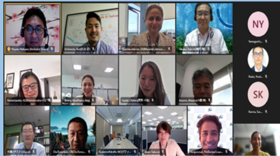
Reunión de reporte del nuevo coordinador general de SIECA