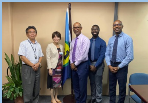
CARICOM アドバイザー森田専門家及び カウンターパートと