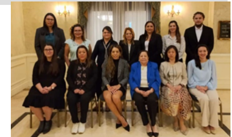
Tercer taller regional