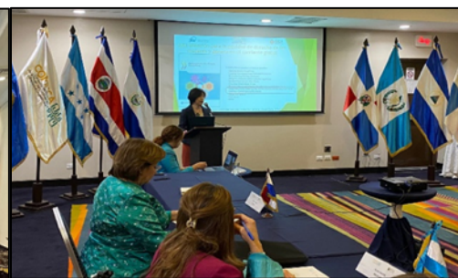
COMMCA 大臣会合での進捗説明