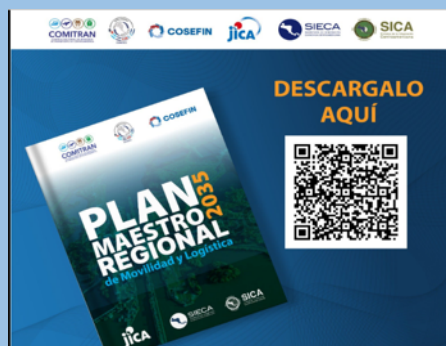
SIECA 作成の中米物流マスタープラン 2035 の QR コード