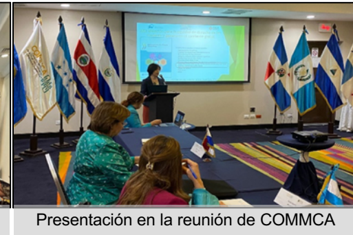
Presentación en la reunión de COMMCA