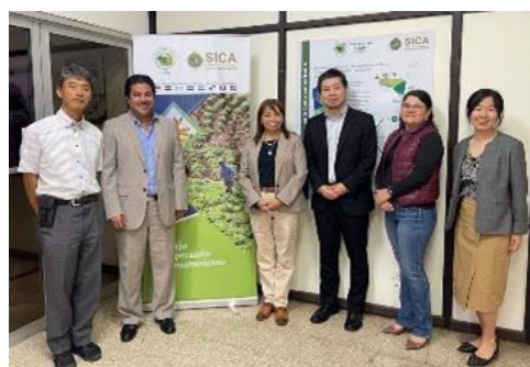
7 月 5 日の会議の後の一枚 ( https://www.facebook.com/SECAC )