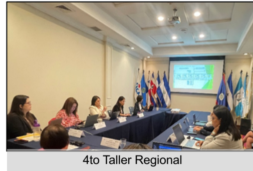
4to Taller Regional