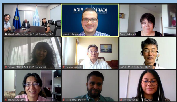
Reunión virtual entre ICAP y JICA para intercambio de información