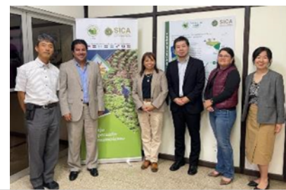
Una imagen tras la reunión del 5 de julio ( https://www.facebook.com/SECAC )