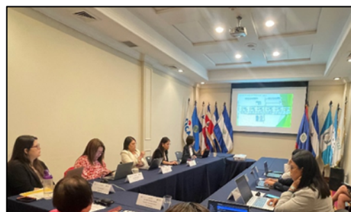
第4回地域ワークショップ開催