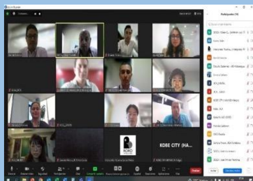
課題別研修の応募要項に係る SIECA との協議