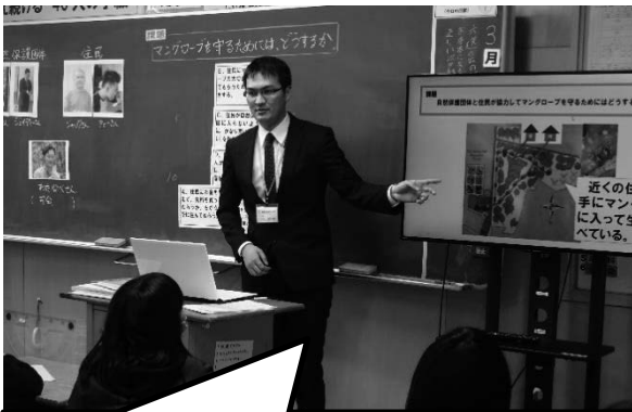
2、本時の課題をつかむ場面。 写真や地図を使うことは課題をつかむうえで有効だった。