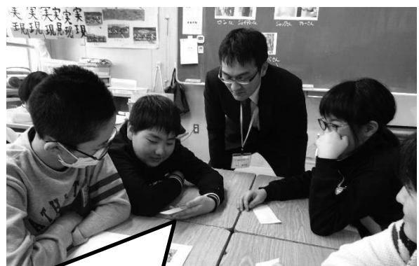
3、ロールプレイ。 住民と自然保護側の対立構造を理解することができた。