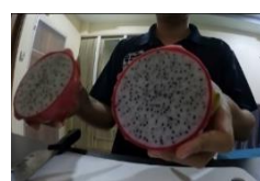
ドラゴンフルーツ