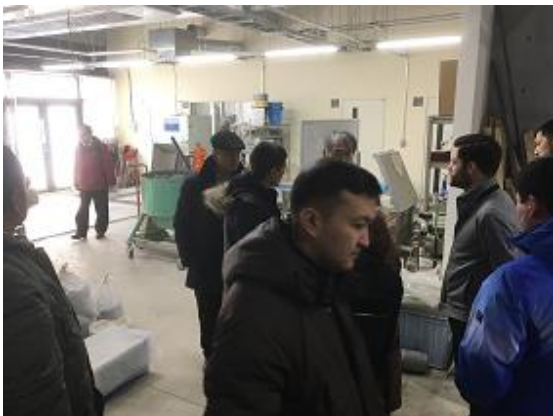
北海道大学土木研究棟視察の様子（1/21）

2/12の「コンクリートテスター実地指導」、2/14の「橋梁点検実習」、2/17の「VRによる維持管理の省人化の取組み」は体験型講義のため特にお勧めです。取材を是非ご検討ください。