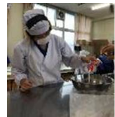
【写真6 チーズパ作り】