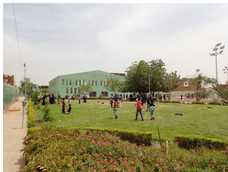
奥にはスーダンでは珍しい体育館。

できない理由をつければ色々言い訳はできますが、私は私ができることを全力でするんだ、と子どもたちの笑顔に毎回励まされています。