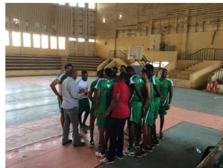
青年男子バレーチーム。ほとんどが190センチを超えています。