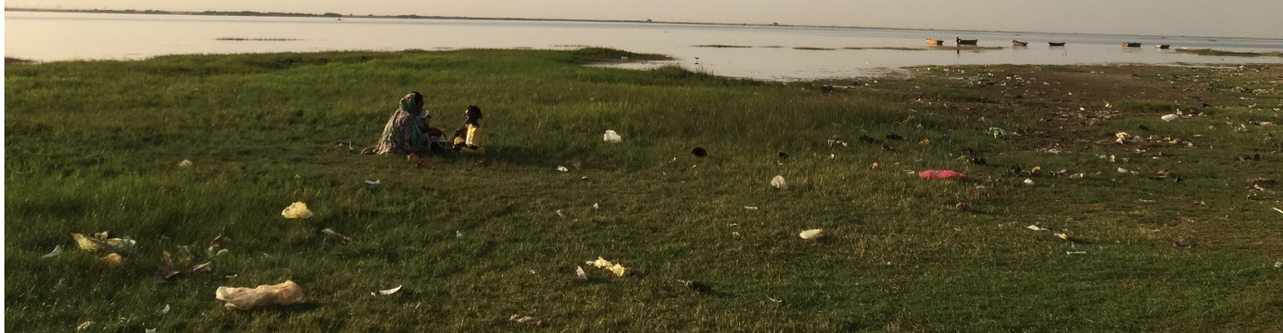
夕暮れ時のナイル川。岸ではたくさんの方がのんびりとした時間を過ごしていますが、その傍らにはゴミがたくさん。