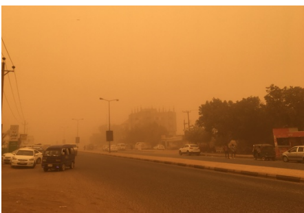
100メートル先も見えない！ですが、バスは普段通り運行中。

慣れない私は目も鼻も喉も砂にやられているのに、子どもたちは頭に砂を積らせながら、いつも通り元気にたくましく遊んでいたのです。