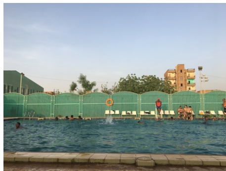
気温45度を超える夏場はプールも大人気！