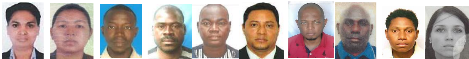
ネパール、バヌアツ、ブルキナファソ、カメルーン、南アフリカ、エルサルバドルからの研修員 （各国の教育省の行政官が主）が参加します！

JICAは、8/30(火)-31(水)にかけて、黒潮町役場と連携し、四国の大学（高知大、鳴門教育大、愛媛大）の大学院にJICA長期研修員として留学中の海外7か国からの10名を対象とした、「地域理解プログラム」を実施します。