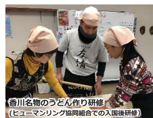
香川名物のうどん作り研修 (ヒューマンリング協同組合での入国後研修)

企業等での社会人経験を経て、青年海外協力隊としてパナマ共和国にて環境教育隊員として2年間活動。帰国後、サンフィールド国際人材育成協会にて外国人技能実習生に対する入国後講習等を担当。