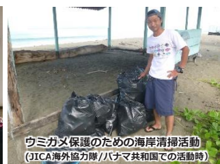
ウミガメ保護のための海岸清掃活動 (JICA海外協力隊/パナマ共和国での活動時)