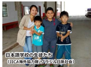
日本語学校の生徒たち (JICA海外協力隊/ブラジル日系社会)

愛媛大学大学院理工学研究科学生。2018年9月より6か月間、国際交流基金アジアセンターの主催する「日本語パートナーズ」事業に参加し、インドネシア共和国に派遣。西スマトラ州ブキティンギにて現地の教員とともに日本語の授業を実施し、3月に帰国。