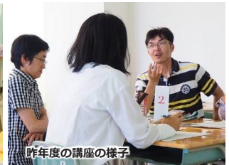
昨年度の講座の様子