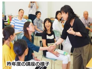
昨年度の講座の様子

愛媛大学国際連携推進機構国際教育支援センター 非常勤講師 トルコ国立チャナッカレオンセキズマルト大学日本語教育学科で講師を勤める。帰国後、愛媛大学で留学生に対して日本語の授業を行う傍ら、ヒューマンアカデミー松山校で日本語教師養成を担当する。