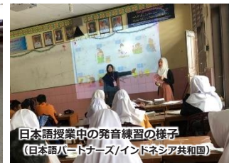
日本語授業中の発音練習の様子 (日本語パートナーズ/インドネシア共和国)