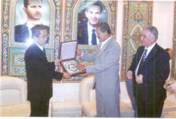
السفير الياباني ومحافظة القنيطرة ووزير الصحة أثناء حفل افتتاح المشفى

قامت الحكومة السورية بإعداد الخطة الخمسية الوطنية التاسعة للتنمية الاجتماعية والاقتصادية. وكان تطوير البنى التحتية للقطاع الصحي واحداً من أهم الأهداف التي تناولتها الخطة. حيث هدفت إلى تطوير وتعزيز نوعية الخدمات الصحية المقدمة في المشافي العامة. كما أنها استهدفت تطوير وبناء مشافي سعة ١٢٠ سريرياً في كافة محافظات سوريا.