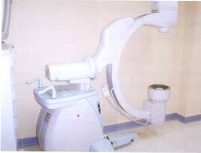
أحد أجهزة التصوير الشعاعي المتطورة

وتحقيقاً لهذه الأهداف فقد بدأت وزارة الصحة في سوريا ببناء مشافي ١٢٠ سرير من خلال الموازنة المخصصة لذلك، ولكن نظراً لعدم إمكانية توفير الميزانية اللازمة لتأمين التجهيزات والمعدات الطبية فقد طلبت الوزارة مساعدة بعض البلدان المانحة بما فيها اليابان.