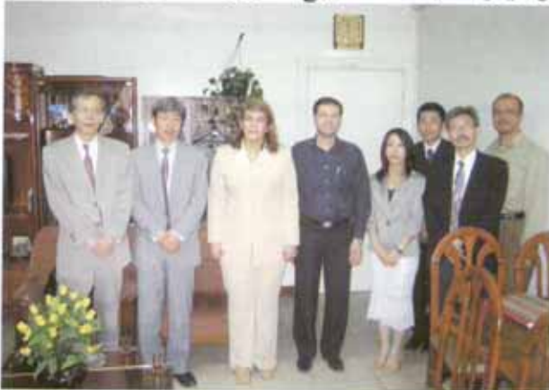
الخبراء وفريق جايجا في ضيافة مديرة العلاقات الدولية في وزارة الزراعة

ويعيد التوقيع على سجل المباحثات في تشرين الثاني الماضي، وفي نيسان ٢٠٠٥ وصل إلى القطر أربعة خبراء للعمل على تنفيذ