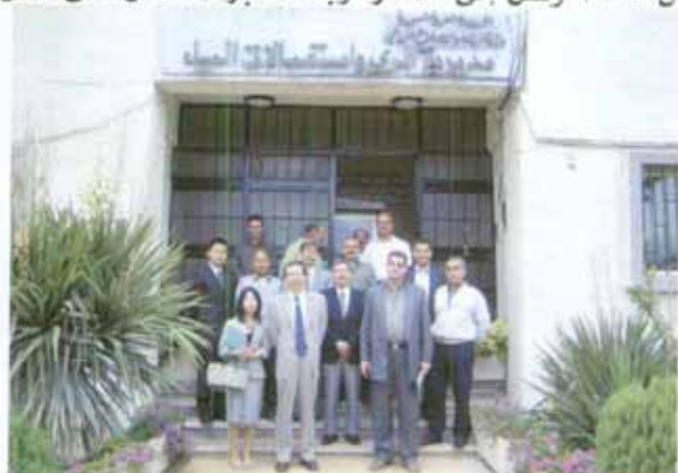
الخبراء وفريق جايجا مع معاون مدير الهيئة العامة للبحوث الزراعية، ومدير إدارة بحوث الموارد الطبيعية