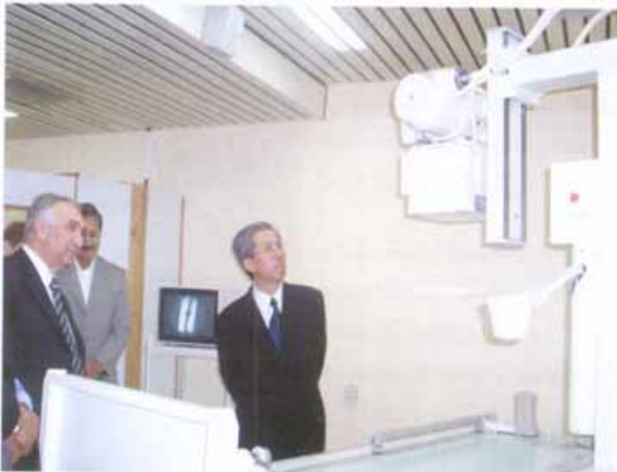
وزير الصحة والسفير الياباني في جولة على أقسام المشفى.

وفي نهاية شهر نيسان ٢٠٠٥ أقيم حفل افتتاح حضره كل من محافظ القنيطرة ووزير الصحة والسفير الياباني وممثلين عن مكتب جايكا إضافة إلى عدد كبير من العاملين في وزارة الصحة ومشفى الجولان حيث قاموا بجولة في أرجائه تعرفوا من خلالها على الأقسام المختلفة وما تقدمه من خدمات طبية وعلاجية.