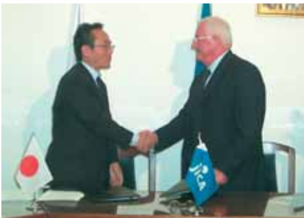
سوريا واليابان .. علاقات تعاون وثيقة

وقام الفريق الرسمي الموفد من قبل المكتب الرئيسي لجايكا يرافقه اثنان من الاستشاريين اليابانيين إضافة إلى المهندسين السوريين المعنيين بالمشروع بزيارات ميدانية للإطلاع على واقع أنظمة الصرف الحالية في عدة مناطق من سوريا، وقام الوفد كذلك بإجراء مناقشات ومباحثات موسعة مع المعنيين في وزارة الإسكان والتعمير والوزارات المعنية الأخرى.