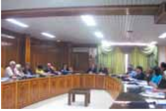
قدم الممثل المقيم ومعاون رئيس هيئة تخطيط الدولة الكلمات الافتتاحية