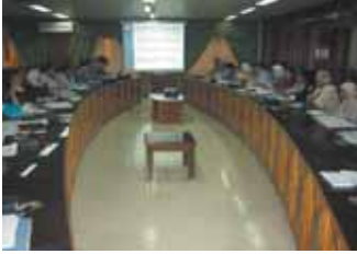
قدم موظفي التعاون في جايا محاضرات عن نشاطات جايا في سوريا

ومن الجدير ذكره أن الوكالة اليابانية للتعاون الدولي في سوريا تنفذ حالياً ثمانية عشرة برنامجاً في القطاعات الأربعة المذكورة أعلاه.