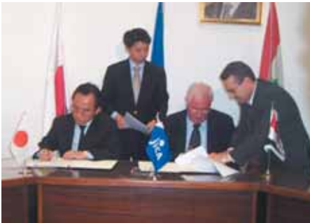
السيد الوزير والسيد كوجيما يوقعان محضر الاجتماعات