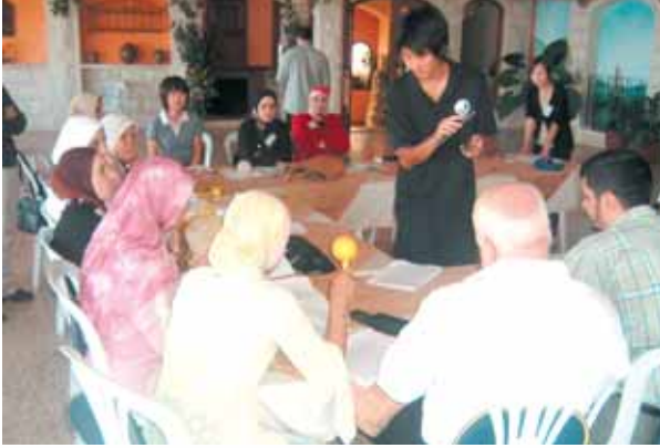
مدرسي الموسيقى في ورشة العمل في حمص