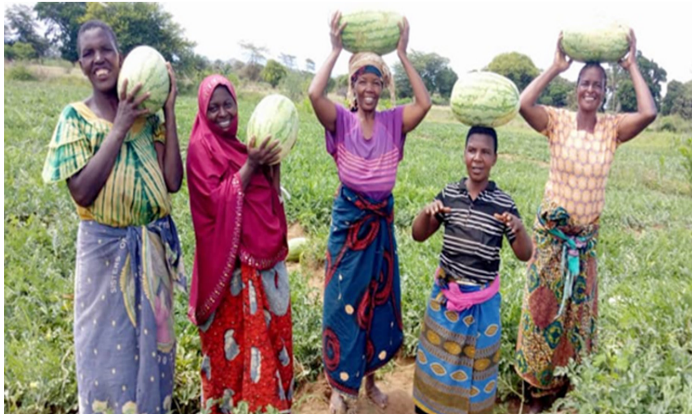
Uvunaji matikitimaji, kikundi cha wakulima cha Migungani Wilaya ya Karatu, Arusha.

Njia ya SHEP sio msaa wa kifedha lakini inatoa fursa kwa wakulima kujua habari na watu kwa biashara yao. Na hii "kujua kitu" inapelekea wakulima kugundua, kuwapa motisha, na kukuza mkakati wa kilimo chao. Kwa mfano, vikundi vya wakulima katika Wilaya ya Karatu, (Migungani, Tujitegemee na Kikundi cha Wakulima cha Migombani) Arusha, ambavyo kijadi walikuwa wanazalisha vitunguu peke yake, viligundua kupitia utafiti wa soko kuwa kulikuwa na mahitaji ya matikiti maji katika masoko ya ndani na gharama ya uzalishaji ilikuwa chini sana kuliko ile ya vitunguu na ina faida. Sasa uzalishaji wao wa mazao umetawanywa ili kukuza uzalishaji wa mbogamboga zenye tija kulingana na mahitaji ya soko na faida. Kwa uuzaji mkakati, TANSHEP inavitaka vikundi vya wakulima kuendelea uchunguzi wa soko kabla ya kuanza uzalishaji na kuendelea kuwasiliana na wanunuzi kujua bei zinazoendelea / zinazotarajiwa hadi kuvuna. Kupitia mchakato huu, wakulima hupata kufikiria kimkakati zaidi