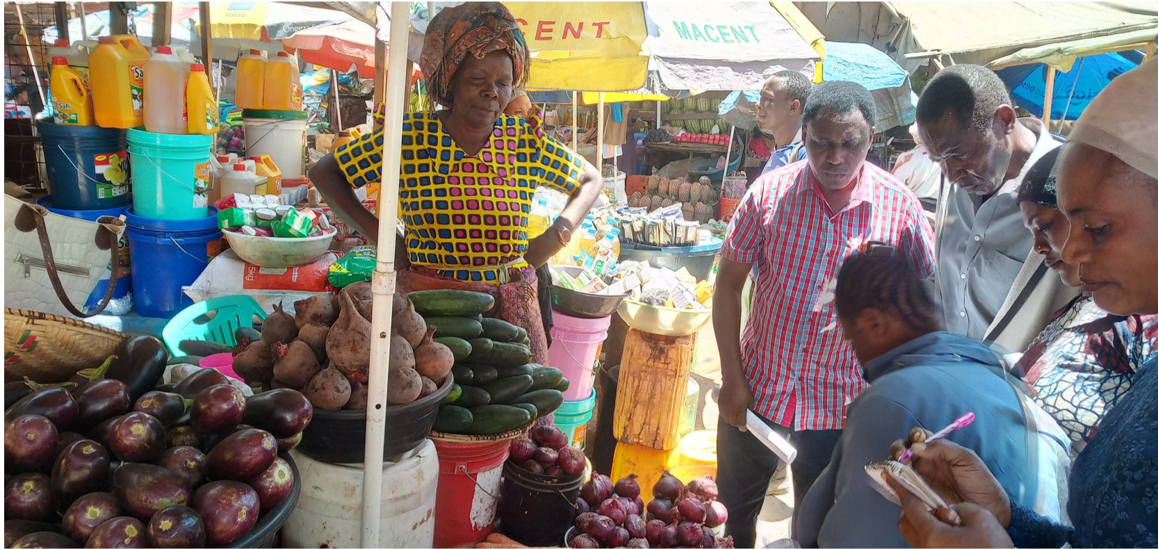
Wakulima wakifanya uchunguzi wa masoko.

Mbegu ya karibu miaka 50 ya urafiki kati ya Tanzania na Japan ilipandwa katika mkoa wa Kilimanjaro mnamo mwaka 1974. Kuanzia mwaka huo Shirika la Maendeleo la Kimataifa la Japani (JICA), lilianza kutekeleza mfululizo wa miradi ya ushirikiano kwa uundaji wa Mpango Jumuishi wa Maendeleo wa Kilimanjaro "Kilimanjaro Region Integrated Development Plan". Baada ya hapo, miradi mbalimbali ya maendeleo ilitekelezwa kama vile "Mradi wa Umwagiliaji wa Lower Moshi ikifuatiwa na "Kituo cha Kuendeleza Kilimo Kilimanjaro" "Kilimanjaro Agricultural Development Center" (ambacho kwa sasa kinaitwa Kituo cha Mafunzo ya Kilimo Kilimanjaro (KATC) "Kilimanjaro Agricultural Training Center".