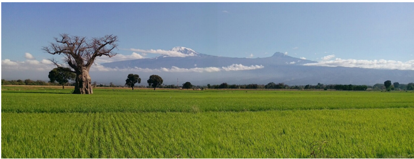
Mashamba ya Umwagiliaji Mpunga ya Lower Moshi.

Ili kutengeneza mafanikio zaidi, juhudi thabiti zinafanywa. Pamoja na TANSHEP, wizara ya kilimo imekuwa ikiangazia njia ya SHEP katika mfumo wa uganu wa kilimo, kupitia marekebisha ya miongozo ya kitaifa ya uganu na mtaala wa mafunzo wa maafisa uganu. Pia imetoa ushauri wa kiufundi kwa walengwa kwa kuhusisha Taasisi ya Utafiti na Mafunzo ya Bustani ya Tengeru (HORTI-Tengeru). TAMISEMI imefanya utaratibu wa kugawana gharama na Mamlaka ya Serikali za Mitaa (LGA) kwa utekelezaji, wakati wa kuhamasisha Sekretarieti za Tawala za Mikoa (RS) kwa ufuatiliaji wa maeneo husika. Tume ya Maendeleo ya Ushirika Tanzania (TCDC) imechangia kuimarisha vikundi vya wakulima kupitia mipango ya mafunzo na ziara za kusoma. Chama cha Kilimo cha Bustani Tanzania (TAHA) kinaipa TANSHEP utaalam wake wa uuzaji na manunuzi kwa mtandao. Kwa kuongezea, mipango kadhaa imeundwa