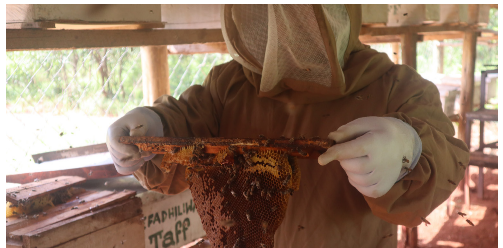
Uvunaji wa asali shambani.