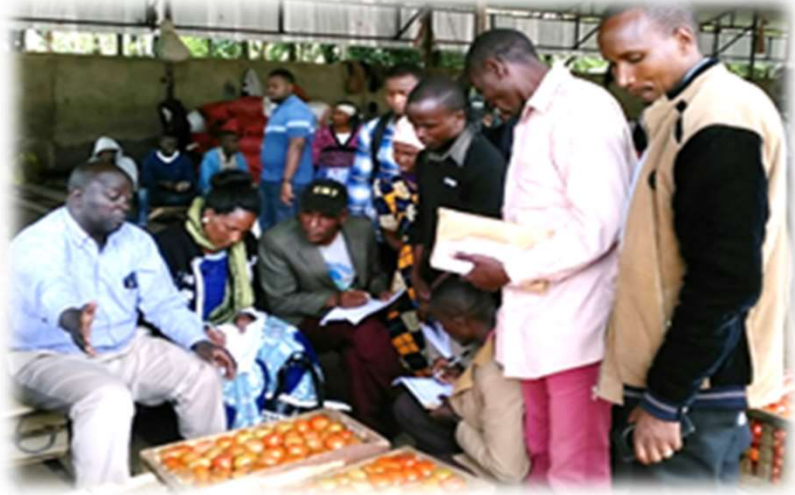
(Picha: Utafiti wa soko uliofanywa na wakulima)

Serikali ya Tanzania na Washirika wa Maendeleo (DPs) wamekuwa wakitekeleza Programu ya Kuendeleza Sekta ya Kilimo (ASDP) tangu mwaka 2003/04. Katika ASDP, kila Mamlaka ya Serikali za Mitaa (LGA) inaunda na kutekeleza Mpango wa Maendeleo ya Kilimo ya Wilaya (DADP), kuendana na eneo.