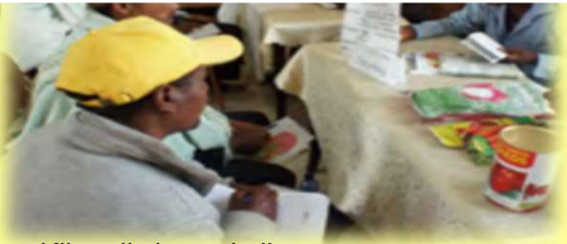
Kikundi cha wakulima