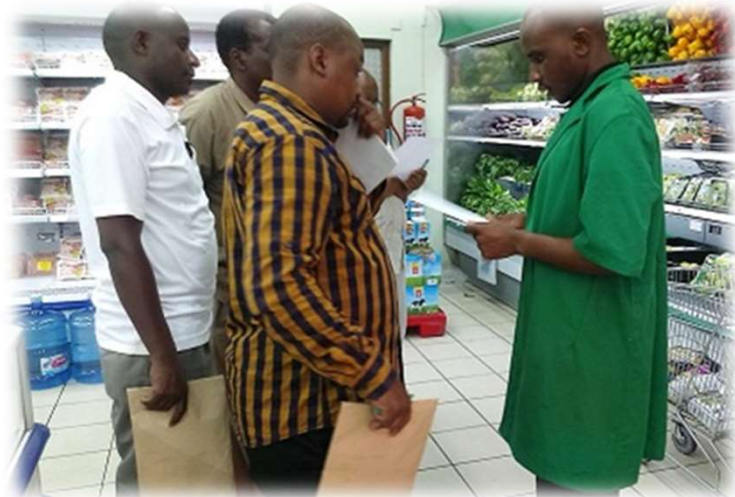
(Picha: Kikundi cha Wakulima Lushoto, Tanga kikifanya Utafiti wa soko)

Serikali ya Tanzania na Washirika wa Maendeleo (DPs) wamekuwa wakitekeleza Programu ya Kuendeleza Sekta ya Kilimo (ASDP) tangu mwaka 2003/04. Katika ASDP, kila Mamlaka ya Serikali za Mitaa (LGA) inaunda na kutekeleza Mpango wa Maendeleo ya Kilimo ya Wilaya (DADP), kuendana eneo.