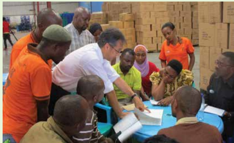
Mafunzo ya Kaizen

Moja ya mafanikio ya kongano yameibuka katika Wilaya ya Singida, ambapo kongano ya alizeti imeanzishwa na inaendelea sehemu hiyo katika kijiji cha Mtinko. Kongano hilo lina wanachama zaidi ya 100 sasa, ambao ni wakulima, wasindikaji na wasafirishaji. Kwa nguvu zao wenyewe, wameweza kuvutia taasisi mbalimbali na kusaidia.