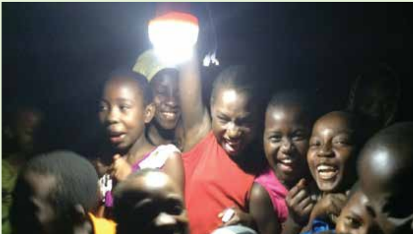
Watoto wakifurahia umeme wa sola

idadi ya wakaguzi bingwa katika taasisi za serikali, mabingwa hawa wanategemewa kuimarisha ukaguzi wa ndani na kuchangia katika mabadiliko katika taasisi za umma katika kuongeza uwajibikaji na uwazi katika matumizi ya rasilimali za umma na mapambano dhidi ya rushwa ambayo ni muhimu kwa maendeleo endelevu.