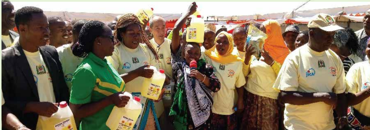
wanasingida wakifurahia mafuta ya alizeti.

WASSHA inamatumaini kuwa mstari wa mbele katika jamii kwa biashara ya umeme wa sola kwa kupitia mtandao wake wa maduka. JICA imekuwa mstari wa mbele kusaidia mradi huu kama Mshirika Mwenza wa WASSHA Inc tangu mnamo mwaka 2016. Ilikuwa mara ya kwanza kwa JICA kusaidia sekta binafsi kwa kuwezesha fedha katika ukanda wa Nchi zilizo Kusini mwa Jangwa la Sahara. JICA inaamini ukuaji wa WASSHA utaleta maendeleo ya kiuchumi katika jamii ya Kitanzania kwa kutoa huduma nafuu za umeme wa sola kwa kukodisha kwa wananchi taa hizo hususani vijijini na kutengeneza ajira.