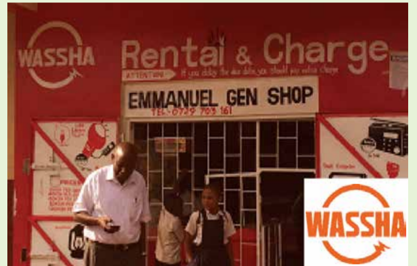
Duka la WASSHA