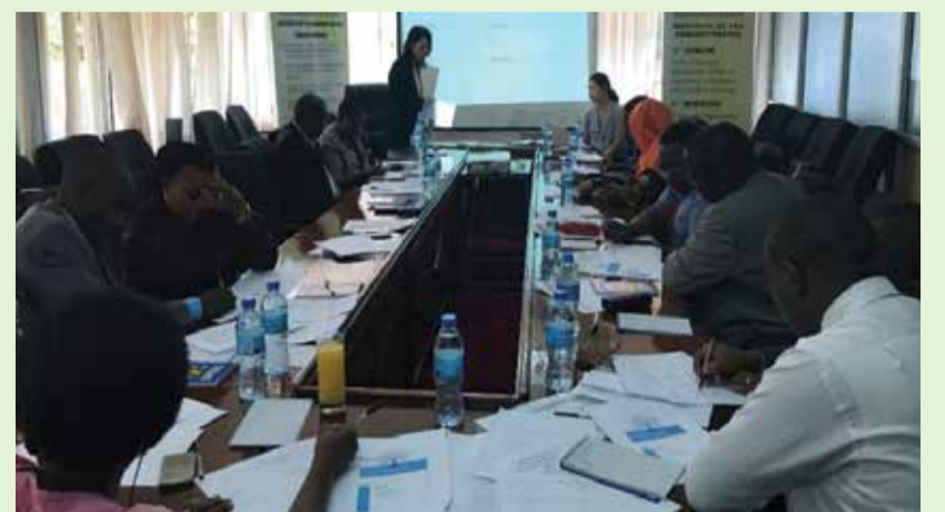
Mafunzo ya wasimamizi wa programu ya kocha na ulezi (coach and mentoring)

Mradi huu utatelezwa mpaka mwaka 2020, utagusa maeneo makubwa matatu kwa ajili ya kuboresha uwezo wa wafanyakazi wa TRA kama ifuatavyo:- Oneo la kwanza, linahusisha uboreshaji wa uwezo wa usimamizi wa kodi kwa wafanyakazi wa TRA kupitia utekelezaji wa mafunzo kutoka chuo cha usimamizi wa kodi Eneo la pili linahusisha juu ya kusaidia uboreshaji mfumo wa kocha na ulezi (coach and mentoring system) wa TRA ambao utawawezesha wafanyakazi wenye uzoefu na ujuzi wa TRA kuwafundisha na kuwalea wafanya kazi wapya wasio na uzoefu na ujuzi Eneo la tatu linahusisha uboreshaji wa mfumo wa mafunzo kwa wafanyakazi kupitia kuboresha mfumo wa ajira (career pathway manual) kwa wafanyakazi wa TRA.