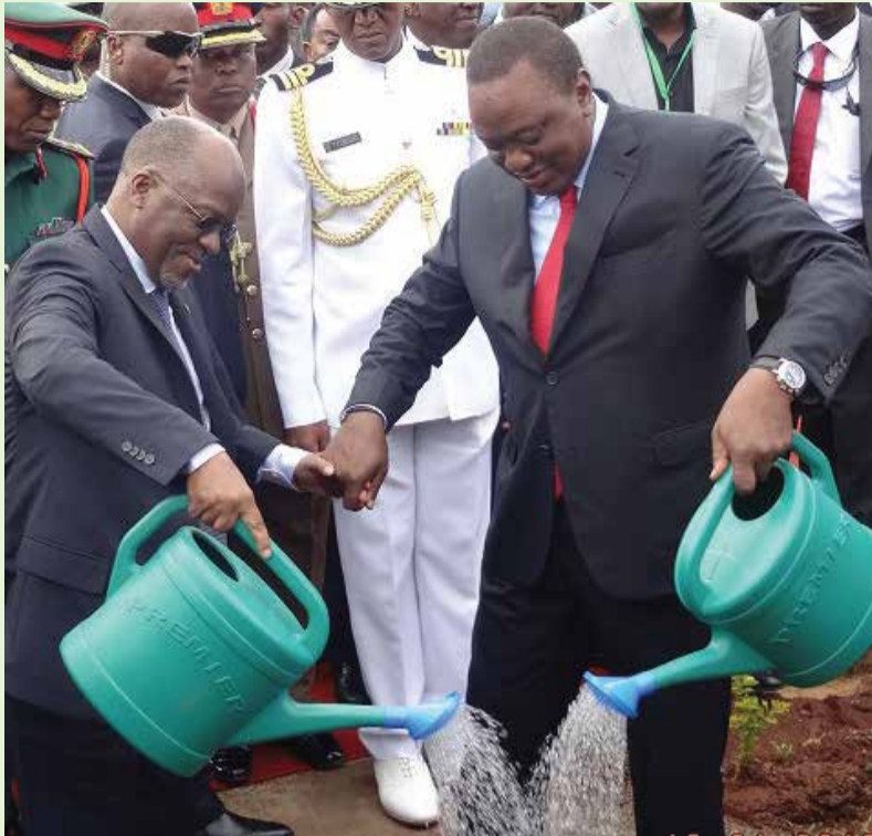
Sherehe za Ufunguzi wa kituo cha forodha cha Namanga

Tangu kuanziashwa kwa programu ya mabingwa wa ukaguzi wa ndani mnamo mwaka 2017, mpaka leo mradi umeweza kutengeneza mabingwa wa ukaguzi wa ndani wapatao 80 kutoka taasisi za umma 57. Mradi pia umeweza kuchangia kuimarisha ujuzi kwa wakaguzi wa ndani ikiwa pia ni pamoja na kuimarisha taratibu