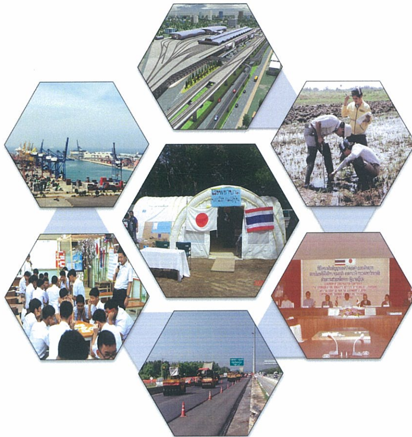
Projects in Thailand under Japan's ODA