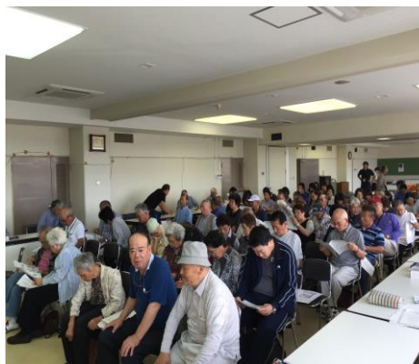
▲ 9月5日(土)に開催された説明会の様子