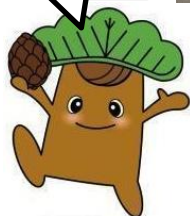
野蒜まちづくり協議会 イメージキャラクター マックくん

ワークショップは、参加者でグループごと懇談しながら意見を出し合って、方向性を決める会だよ。