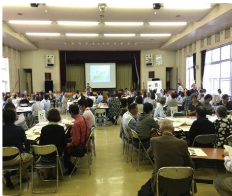
▲ 9月6日(日)に開催された西部エリア顔合わせ会の様子