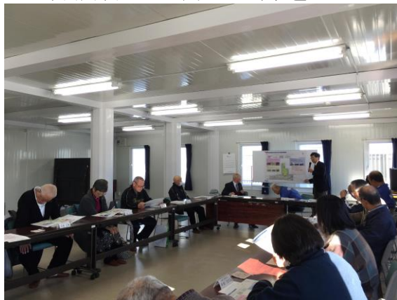
▲役員からの意見も集められました。

画の三点が説明されました。基本コンセプトは『震災の記憶を広く伝え、鎮魂の思いと共に生きる大切さを分かち合う場』です。 また、検討イメージを基に野蒜まちづくり協議会役員との意見交換会を行いました。前回の役員会から意見交換が行われており、野蒜築港の資料を置きたい等の要望や、完成した場合の管理人や来館者への案内人をどうするか等の意見が出ました。市の担当課は今後、役員の見聞も踏まえながら詳細を詰めていきたいと考えています。同整備計画は、平成28年度中に進められる予定です。