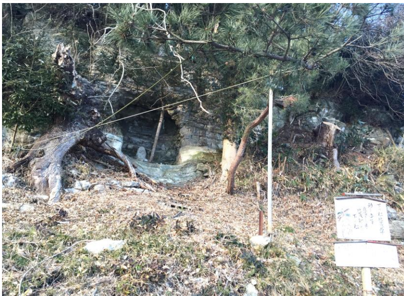
▲今在る松は平成初期に植樹された。