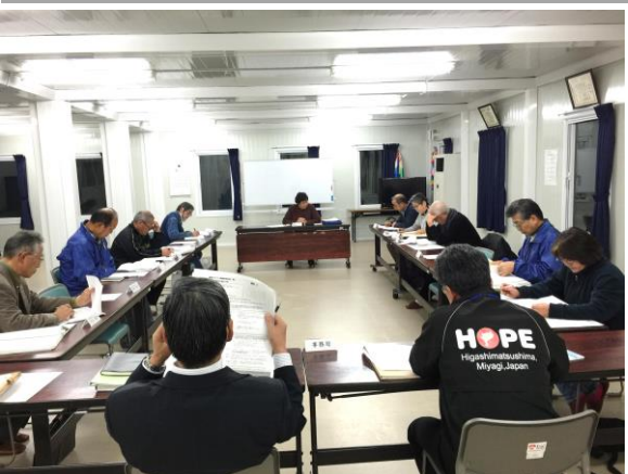
▲1月14日(木)に開催された委員会の様子

昨年、実施されたアンケートを基に、現在設置している専門部会の今後の在り方について話し合われている第3回目の専門部会検討委員会が1月14日(木)に開催されました。これまで協議を重ねてきた結果、今後新年度に向けて現在の専門部会を見直しする方針が示されました。詳しい見直し内容については今後の協議で決定しますが、この見直しにより、現在野蒜地域が抱えている人口減少や高齢化等の課題に沿った部会活動を行うことがこれまで以上に可能となる。3月に完成が予定されている野蒜まちづくり計画に沿った活動も期待されています。次回の検討委員会は2月2日(火)に予定されており、詳しい見直し内容が協議される予定です。