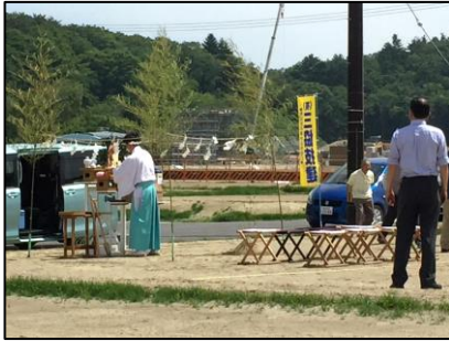
宅地引渡し式終了後、地鎮祭を実施する世帯もありました。

5月28日(土)に野蒜北部丘陵地区(野蒜ヶ丘)の最初の宅地引渡し式が開催されました。