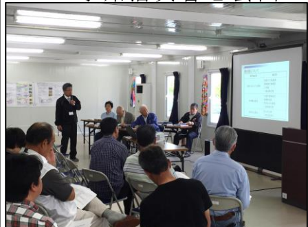
▲5月29日(日)専門部会全体会の様子