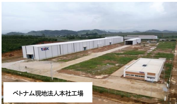
ベトナム現地法人本社工場

上記課題に対して、提案企業から低コスト型短橋梁建設技術「イージーラーメン橋」を提案いただきました。本技術は、5~25m程度の短橋梁に適しており、鋼構造とコンクリート構造を組み合わせた点に独自性があります。本技術により、耐久性が高く低コストでの橋梁建設が可能となり、維持管理コストも低減できます。提案企業では、この独自技術を強みとしてベトナム側パートナーを確保、ベトナム政府予算による短橋梁の受注を目指し、その可能性を案件化調査で調査します。