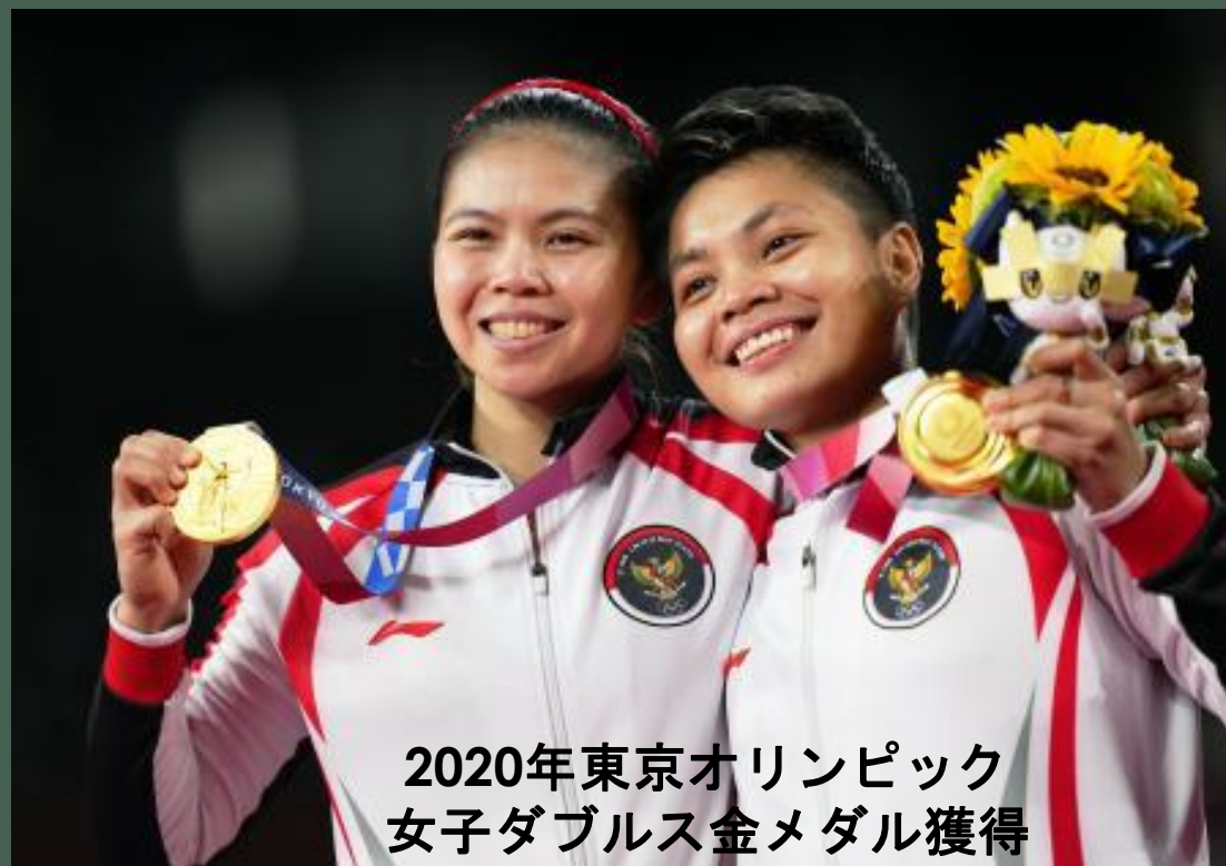
2020年東京オリンピック 女子ダブルス金メダル獲得

インドネシアの国民的スポーツ といえばバドミントンです。 オリンピックで表しょう台を 独占したことがあります。