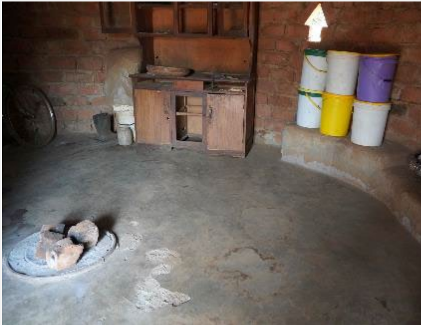
キッチンやダイニング