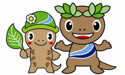
森っこサンちゃん

貴重なサンショウウオの卵が見られる、 素敵なハイキングコース をご紹介します。出発は武蔵五日市駅→三内自治会館脇道を通り→三内神社→ここで一息!! 休憩と、お参り。ここから山深く入ります→季節の花を楽しみながら道に沿って歩き、石山の池を目指します。途中看板がありますのでご心配なく→石山の池到着。昔は伊奈石の石切り場と言われていました。この池にサンショウウオの卵はいましたよ!! じっと目を凝らし、池の中を見るとカエルの卵のようにいました。水が綺麗なところに生息しているのでしょうか。みんなで池を囲み、写真撮影の始まり→サンショウウオに別れを告げ、横沢入りを目指します→看板に沿って、山道を歩きます→綺麗な山袖を歩き、横沢入りに到着→横沢の素敵な風景や田んぼを見ながら、大悲願寺の桜道を通り、川沿いを歩き武蔵五日市駅に無事到着。ゆっくりと歩き2時間コースです。風景、桜道と見所満載のコースです。ゆっくりと、穏やかにそして力強く流れる自然に触れてみてください。時期が良ければサンショウウオに出会えます。