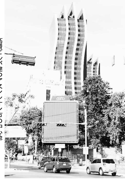
高層ビルが建つアスンシオン市の中心地

南米大陸のほぼ中央に位置する内陸国のパラグアイ。都市部は高層ビルの建設が進み、近代化が目覚ましい。赤土の道が伸びる農村部も見た目のインフラが整備されてお