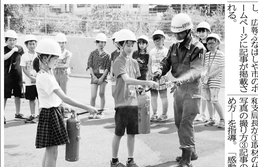
火災の際の初期消火の重要性を学び、消火器で消火する子ども記者

船橋市から委嘱された子ども記者が最新の消防訓練施設などを取材して記事に挑戦。本紙記者が書き方を指導し、本格的な取材・執筆を体験した。市消防訓練センターを訪れて取材し、その場で記事作成に挑戦。本紙記者が書き方を指導し、本格的な取材・執筆を体験した。市消防訓練センターを訪れて取材し、その場で記事作成に挑戦。本紙記者が書き方を指導し、本格的な取材・執筆を体験した。