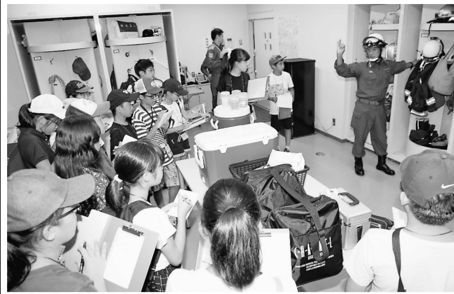
出動準備室で、消防署員の装備などを取材する子ども記者＝船橋市消防局東消防署古和釜分署・消防訓練センター