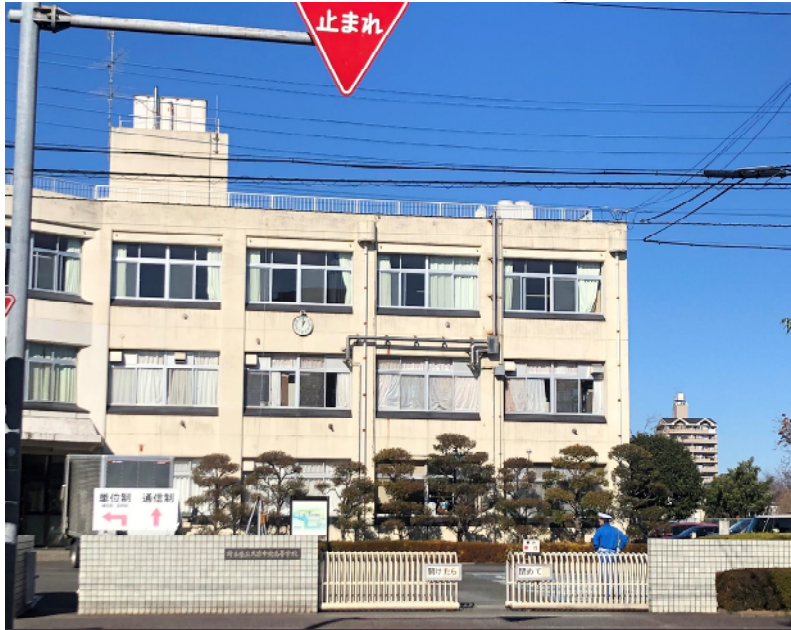
埼玉県立大宮中央高校