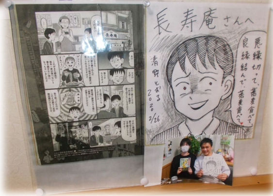
縁切り榎隣のお蕎麦屋さん