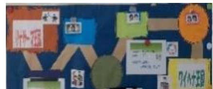
避難ルートマップ