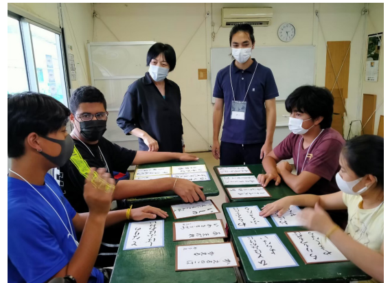
教師国内研修フィールドワーク