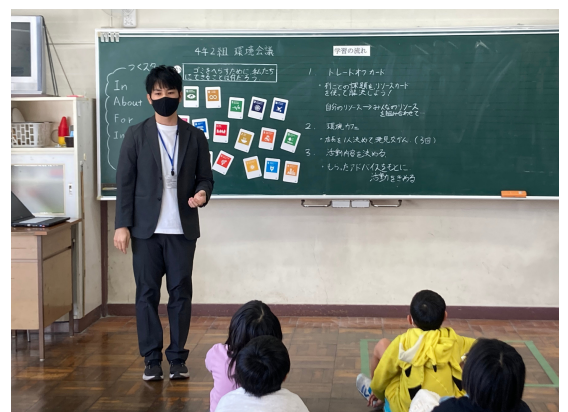
SDGsをテーマとした実践授業