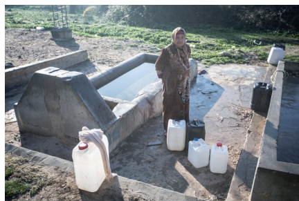
Point de collecte d'eau à Jendouba