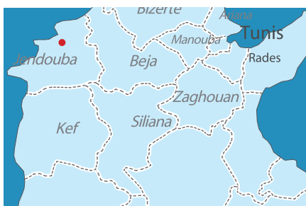
zones du projet