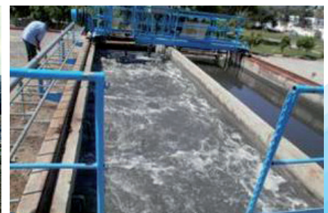
Station d'épuration de TABARKA