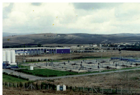
Station d'épuration de BEJA