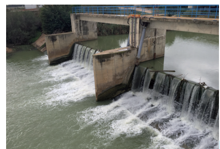
Barrage Tobias situé en aval de l'Oued Mejerda