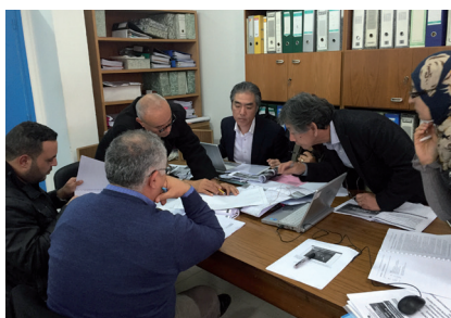
Réunion technique avec le Ministère de l'Agriculture