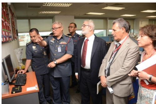
Office de la Protection Civile en Malaisie

C'est dans le cadre de la phase 2 du projet KAIZEN qu'un groupe de 9 responsables tu-