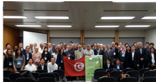
Participants au 1 er comité conjoint de coordination du projet, organisé à Tsukuba le 16 septembre 2016

http://www.jica.go.jp/english/our_work/science/satreps.html