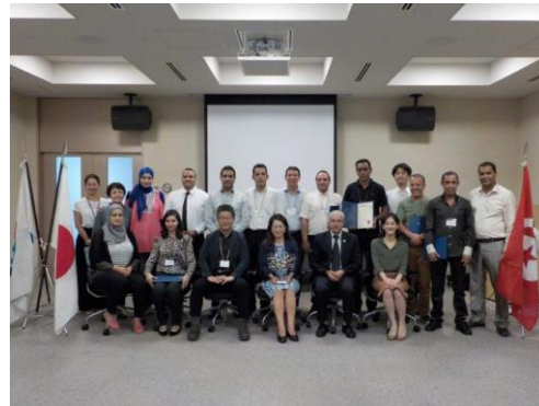
Photo de groupe des stagiaires au Japon

était aussi l'occasion pour les experts japonais de discuter avec la partie tunisienne des besoins prioritaires en formation à considérer pour la suite du programme de coopération en cours. Au programme de cette mission, un atelier intitulé «Cogestion des Pêcheries Côtières et Perspectives de Valorisation des Produits Halieutiques en Tunisie » a été également co-organisé le 18 avril courant à Tunis, avec la Direction Générale de la Pêche et de l'Aquaculture au Ministère de l'Agriculture, des Ressources Hydrauliques et de la Pêche.