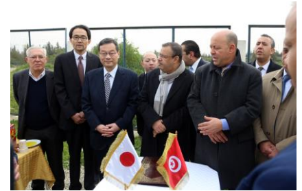
Inauguration du Projet

En effet, l'année hydrologique 2016-2017 et 2017-2018 sont des années plutôt sèches et la réalisation de ce projet a permis de satisfaire les besoins en eau potable de plus de 5,6 millions d'habitants.